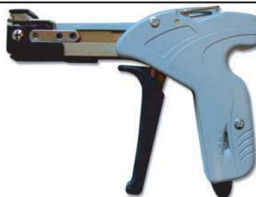
Nářadí pro ocelové stahovací pásky